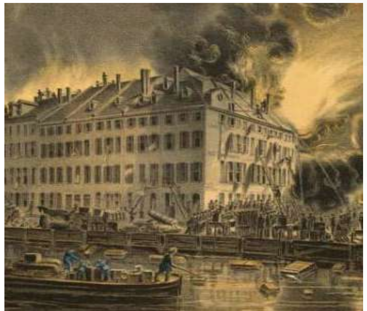
א שרעקליכע שריפה האט אויסגעבראכן אין ר' זלמן'ס קעשענע

נישט דאס, בערל נישט דאס, דו האסט שוין פארגעסן, אבער מיר ליגט עס נאך אין די ביינער עס שטייט מיר פאר די אויגן. דו געדענקסט נאך די זעלבע זילבערנע טאבאק פושקע וואס דו האסט געוואלט שמעקן ווען דו ביזט געווען