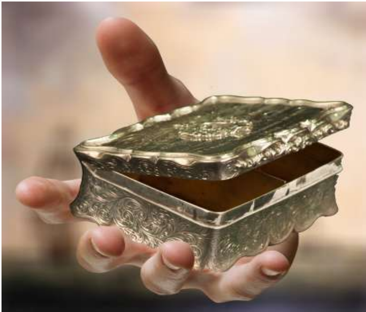
וואס מיינ געוועזענע טאביק פושקע ליגט ביי בערל אין האנט

אין אזא מצב וואס איך בין יעצט און איך האב דין פארווארפן, וואס דער הייליגער בארדיטשובער האט מיך געזאגט אז אלס איז געקומען מיין גאנצע ארימקייט איז נאר געקומען וועגן דעם און עס איז אריבערגעגאנגען צו דין, האב איך געווארט פאר א געלעגנהייט אז עס זאל קענען צוריקקומען צו מיך דורכדעם וואס איך זאל דין ארויסנעמען פון די כלים, און עס געלונגט מיך נישט, עס איז מיר נישט געגאנגען, יעצט בין איך א פארפאלענער.