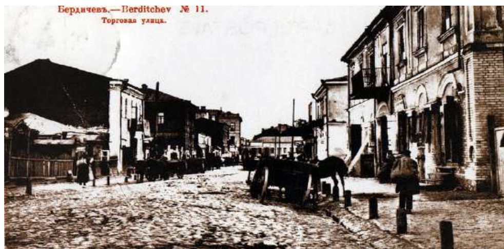
דער שטעטל בארדיטשוב אין יאר תרס"ה

ר' בערל טראכט צו זיך, אה כאטשיג עפעס וועל איך