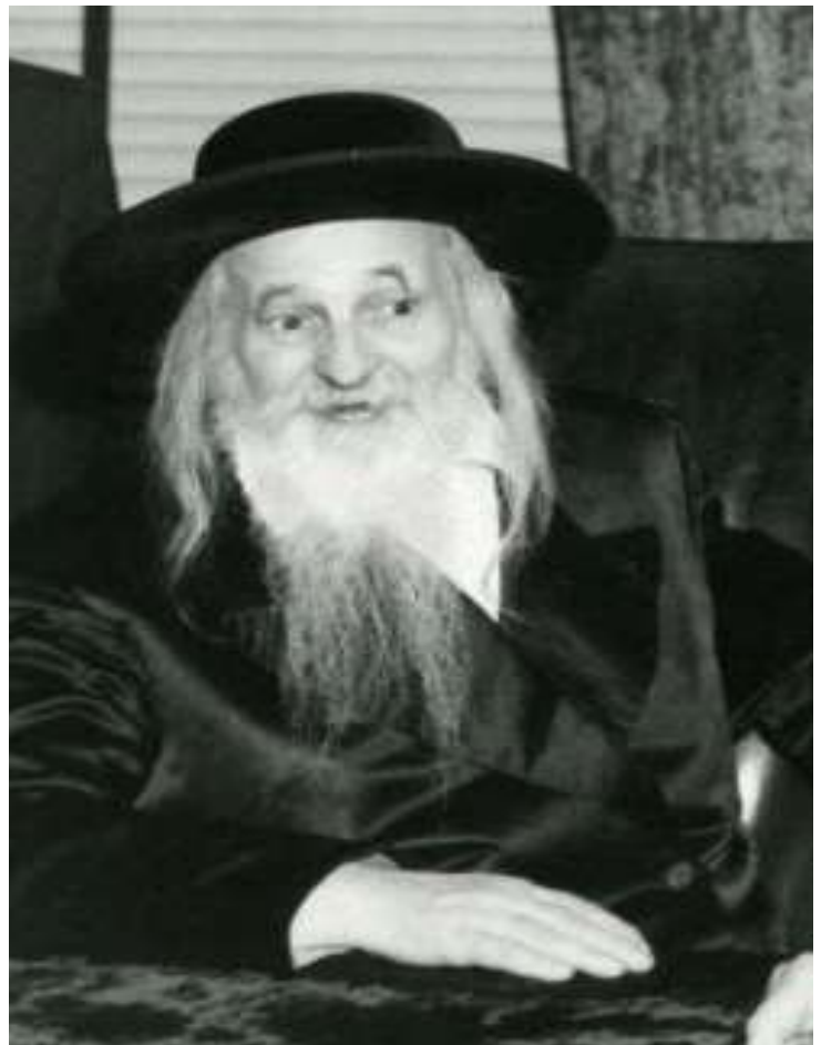
אדמו"ר מסאטמאר זי"ע