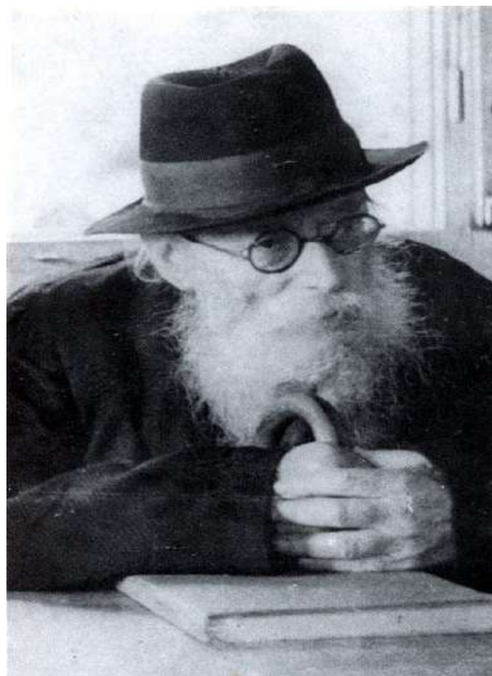
החזון איש זי"ע