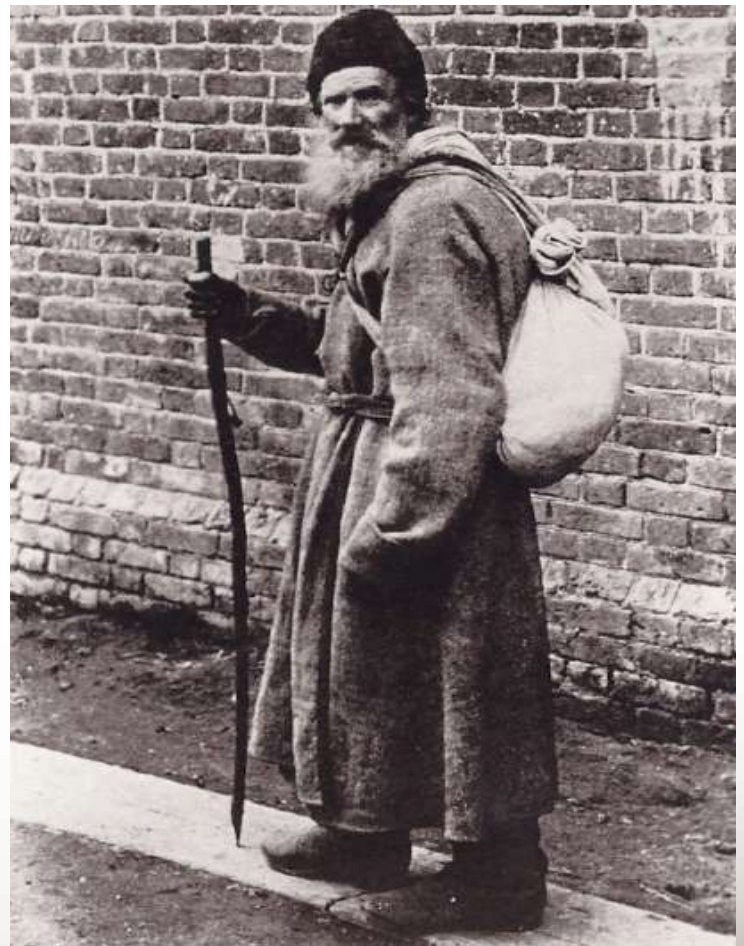
אזוי דרייט זיך בערל ארים ווי א בעטלער, שרעקליך הונגעריג