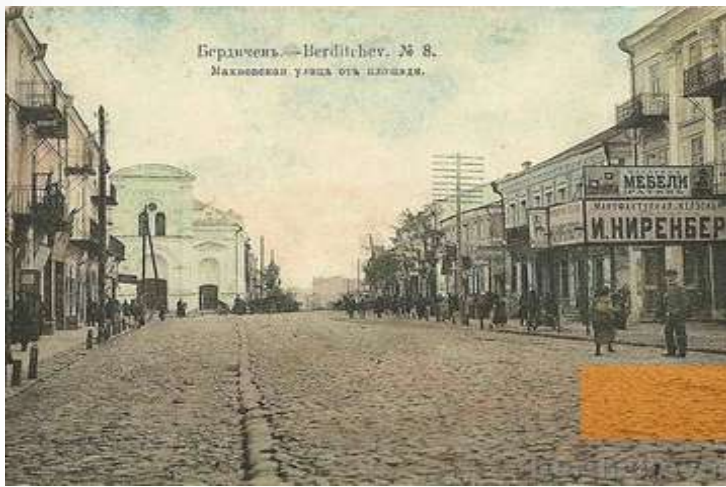
דער אידישער געגענט אין דעם שטעטל בארדיטשוב - דער שוהל זעהט מען פונדערווייטנס