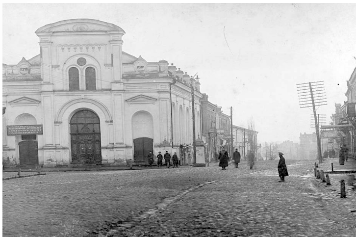
איינע פון די צענדליגע שוהלן אין בארדיטשוב

דער אויבערשטער שטעלט אויף דער ארימאן פון די שטויב, איך בין גארנישט געווען, איך האב געטראכט צו מיך "אפילו צו א שמעק טאבאק בין איך נישט ווערד", אוי טאטע איך דאנק דיר, כי טוב השם וייל דער אויבערשטער איז גוט , און אזוי דאנקט ער דער אויבערשטער און ער האט אפגעקויפט די זילבערנע טאבאק פושקע, דאס מוז איך האבן. ער האט עס אוועקגעלייגט אין די שאפע דארטן און ער האט געטראכט צו זיך, טאטע יעדע מאל וואס איך זעה דאס דאנק איך דיר.