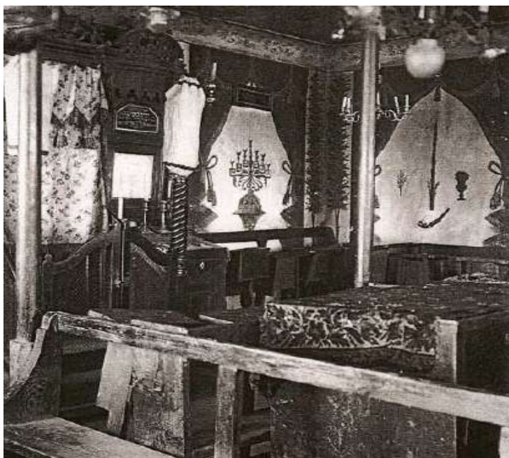
דער גאר אלטע ביהמ"ד אין בארדיטשוב