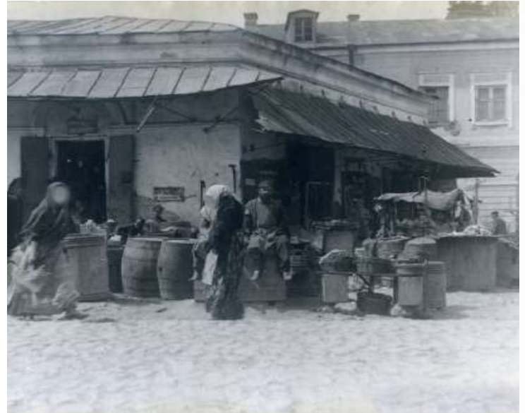
דער מארק אין שטעטל בארדיטשוב - פאר'ן קריג